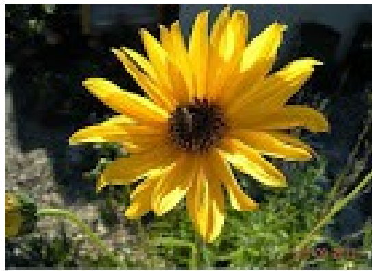
Mon Seigneur pour la beauté des fleurs !