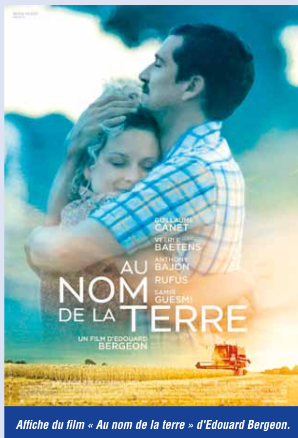
Affiche du film « Au nom de la terre » d'Edouard Bergeon.

Quand Paulette parle de sa campagne, elle a le même enthousiasme lorsqu'elle exprime sa joie admirative devant le jour qui se lève sur la nature environnante. Spontanément, elle reprend les paroles du « Psaume de la création » pour dire sa foi dans le Dieu créateur et sa reconnaissance envers cette terre dont elle se sent responsable. Avant mon départ, elle me montre, avec fierté, les champs ainsi que le troupeau de vaches et les jeunes veaux qui attendaient avec fébrilité de pouvoir, dans quelques heures, quitter les étables pour les pâturages. Pour elle et son mari, comme pour les bêtes, c'est la joie avec la fin de l'hiver ! Une nouvelle saison commence... Mais elle ne peut accompagner son mari sur les marchés où les jeunes veaux seront vendus « Je leur suis trop attachée ! ». Elle parle sans jugement des personnes du village, portant avec les siens le souci de la fête locale. Elle évoque aussi sa responsabilité par rapport à l'Eglise dont elle garde la clé. Elle y anime des célébrations, des funérailles en particulier. « Moi qui suis timide, j'ai beaucoup grandi par la prise de parole en public et j'ai pris de l'assurance. » Oui, « au bout du chemin », j'ai rencontré une femme qui, dans la simplicité de sa vie, témoigne d'une harmonie toute spirituelle à l'égard de ce qui la passionne sur un chemin d'humanité.